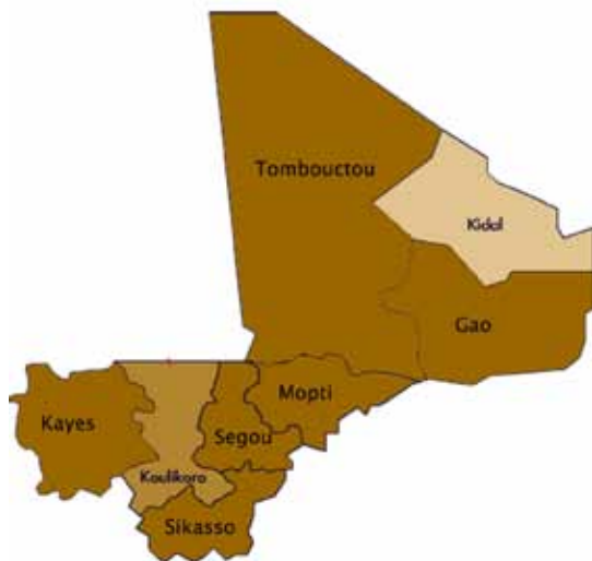
Couverture géographique du réseau IKON au Mali (en couleur chocolat).