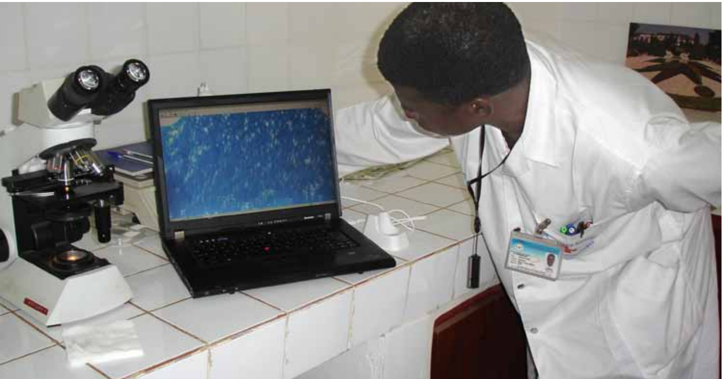
Le Centre d'expertise et de recherche en télémédecine et e-Santé, basé à l'hôpital Mère-Enfant à Bamako, utilise les TIC pour améliorer la santé.