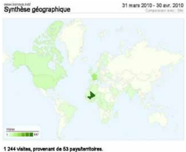
Synthèse géographique des visiteurs du site de mars-avril 2010.

l'expertise d'un radiologue par Internet. Ce projet d'intérêt communautaire vise à créer un réseau national de téléradiologie fiable et opérationnel, avec des objectifs spécifiques pour les populations, les centres de santé éloignés, le système de santé du Mali et les médecins exerçant en zones éloignées. Il s'agit du premier réseau national de téléimagerie médicale en Afrique, qui relie tous les hôpitaux régionaux du Mali au Centre Hospitalier Universitaire du Point G à Bamako.