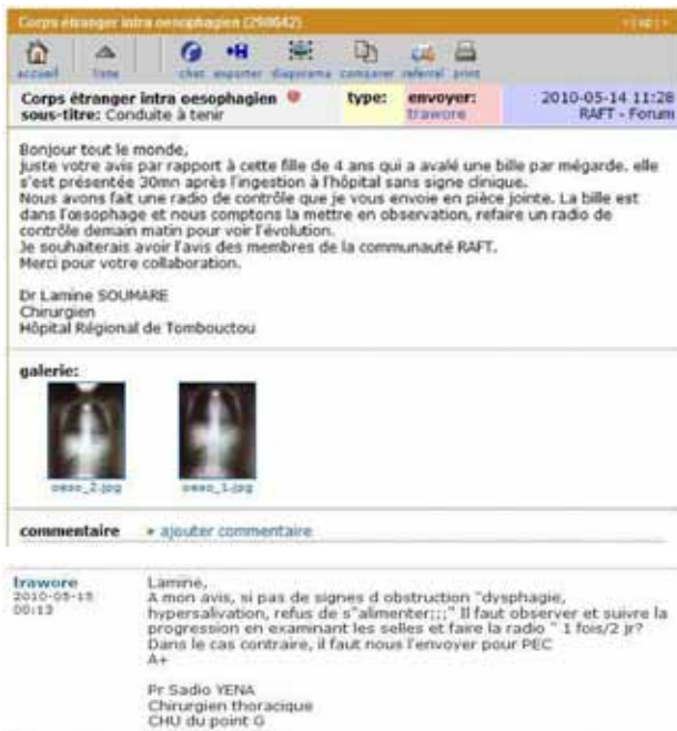
Prise en charge d'un cas provenant de la région de Tombouctou (au nord du Mali) par un spécialiste de Bamako (capitale du pays).

continue dans une douzaine de structures de santé au Mali. Ces cours sont donnés à travers le Réseau d'Afrique Francophone de Télémedecine chaque jeudi matin. Parmi ces cours, 28 ont été dispensés par des experts maliens. Le nombre de participants dans chaque structure varie de 5 à 50 selon le domaine d'intérêt du cours. Par exemple, les cours en e-diabète génèrent un grand intérêt et de ce fait, ils remplissent bon nombre de salles de cours.