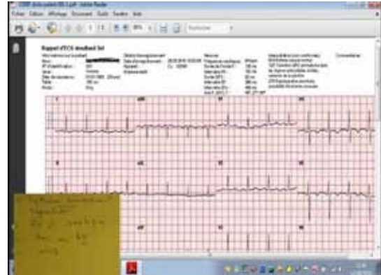
Aperçu d'une image échographique soumise à l'expert radiologue via Medbook® et d'un tracé ECG.